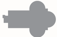
7 St. Maria im Kapitol Kasinostraße 6