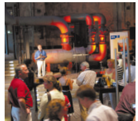
Großer Andrang bei der Eröffnung der SoundART 2005 in Duisburg.

In diesen Wochen ist eine DVD-Dokumentation der SoundART und des Deutschen Klangkunst-Preises erschienen, die über www.soundart-nrw.net kostenlos erhältlich ist.