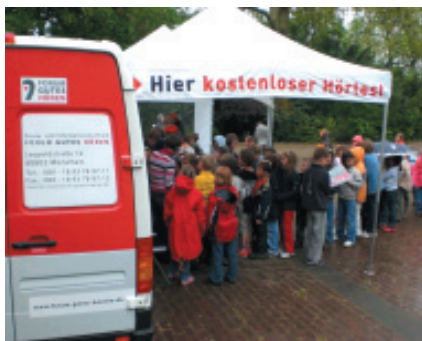
Hörmobil beim Aktionstag "Klassenraumakustik"

Partner des Aktionstages von DEGA und INITIATIVE HÖREN in Brühl waren Forum Gutes Hören, Schule des Hörens, Verbraucherzentrale NRW, Umweltberatung Brühl und die Stadt Brühl.