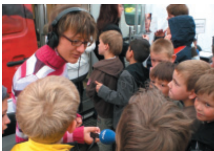
Interviews beim Tag gegen Lärm

Um für das Hören zu sensibilisieren, ein Bewusstsein über die Bedeutung des Hörsinns zu schaffen und mit Ideen, Konzepten, Veranstaltungen und Bildungsmedien insbesondere auch Hörschäden bei Kindern, Jugendlichen und Erwachsenen vorzubeugen, engagiert sich die Initiative Hören seit Jahren für den Tag gegen Lärm. Die Deutsche Gesellschaft für Akustik (DEGA) koordiniert den Tag gegen Lärm deutschlandweit.