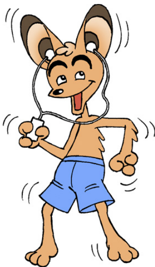
AUDITORIX mit Kopfhörern

„Für die digitale Tonaufzeichnung und -bearbeitung gibt es mittlerweile einfache Standards. Digitale Aufnahmegeräte mit passabler Aufnahmequalität sind nicht mehr teuer und auch so bedienerfreundlich, dass sie schon im Unterricht und im Ganztage der Grundschule eingesetzt werden können“, erläutert Prof. Karl Karst, Vorstandsvorsitzender der INITIATIVE HÖREN und Gründer der SCHULE DES HÖRENS. „Damit ist eine weitere Möglichkeit geschaffen, das Basisthema Hören und die Ausbildung der Sinneskompetenz bei Kindern durch selbstständiges spielerisches Experimentieren in den frühen Unterricht und die medienpraktische Arbeit im Ganztage einzubeziehen. Gleichzeitig lernen Kinder durch das technische Produzieren und Präsentieren der eigenen Aufnahmen praxisnah die Machart und Wirkung von Medien kennen und kritisch zu beurteilen.“